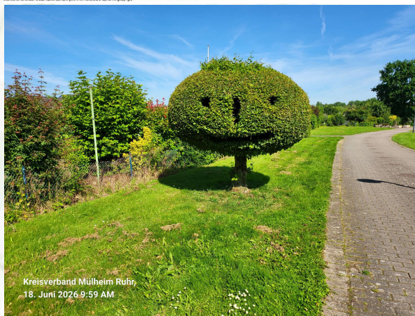
Kreisverband Mülheim Ruhr, 18. Juni 2026 9:59 AM