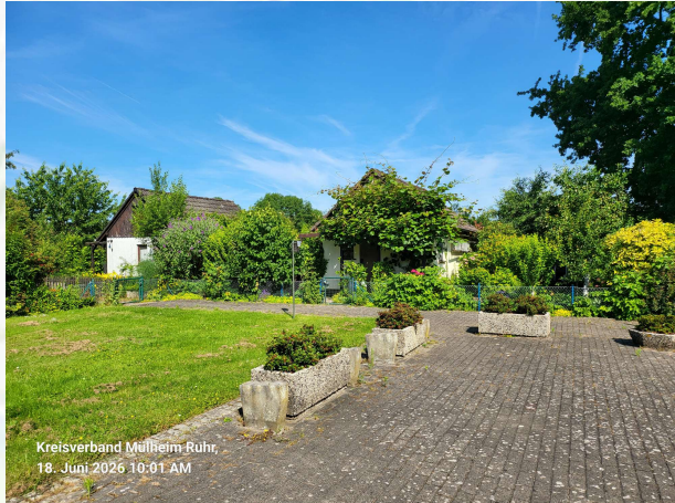
Kreisverband Mülheim Ruhr, 18. Juni 2026 10:01 AM