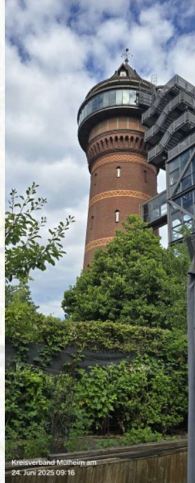
© Bild: Blick aus der KGA