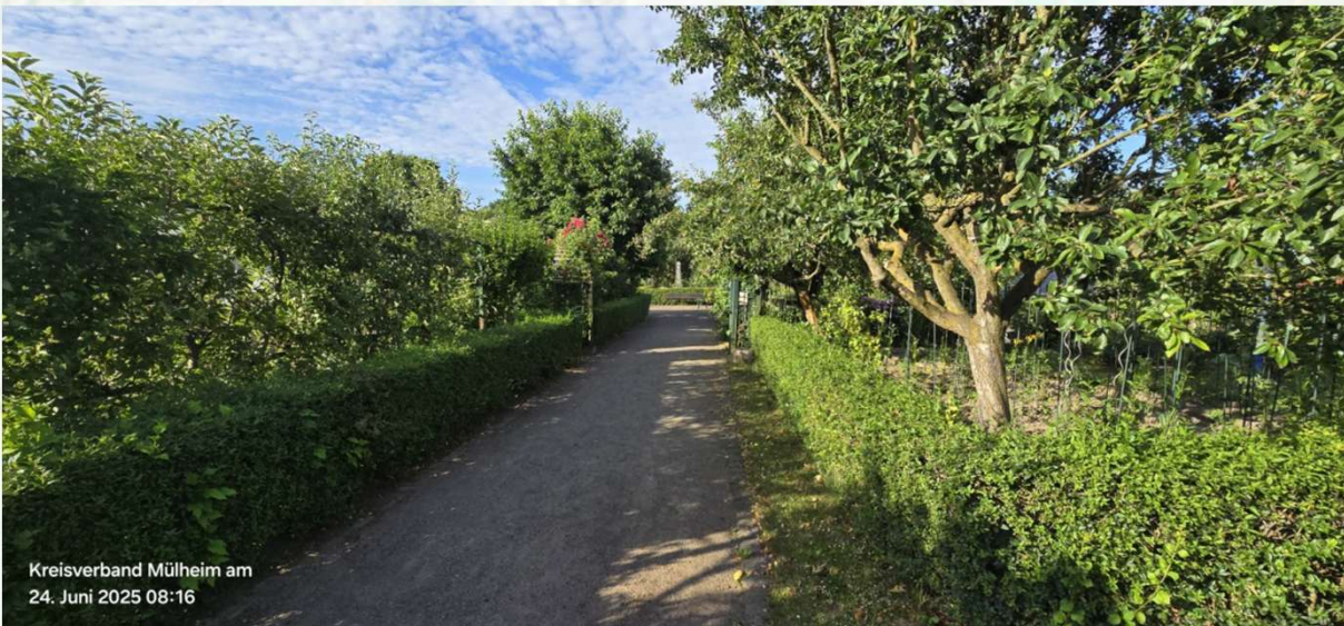
Kreisverband Mülheim am 24. Juni 2025 08:16