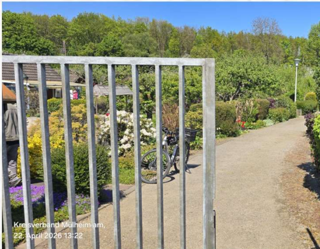
Kreisverband Mülheim am, 22. April 2026 13:22