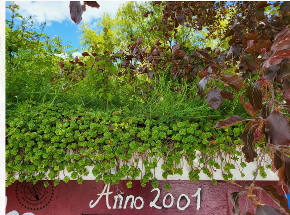
Dachbegrünung in einem Garten