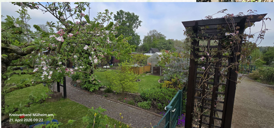
Kreisverband Mülheim am, 21. April 2026 09:22