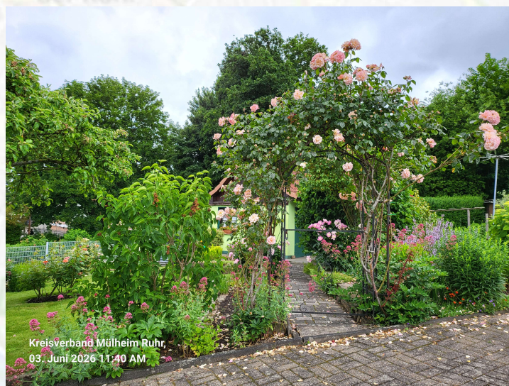
Bild links © Kreisverband Mülheim an der Ruhr der Kleingärtner e. V.: Umgestaltung des öffentlichen Bereichs durch Vereinsmitglieder, hin zu ökologisch wertvollen Flächen. Dieser Bereich wird gern von den Kindern der gegenüberliegenden Grundschule besucht..